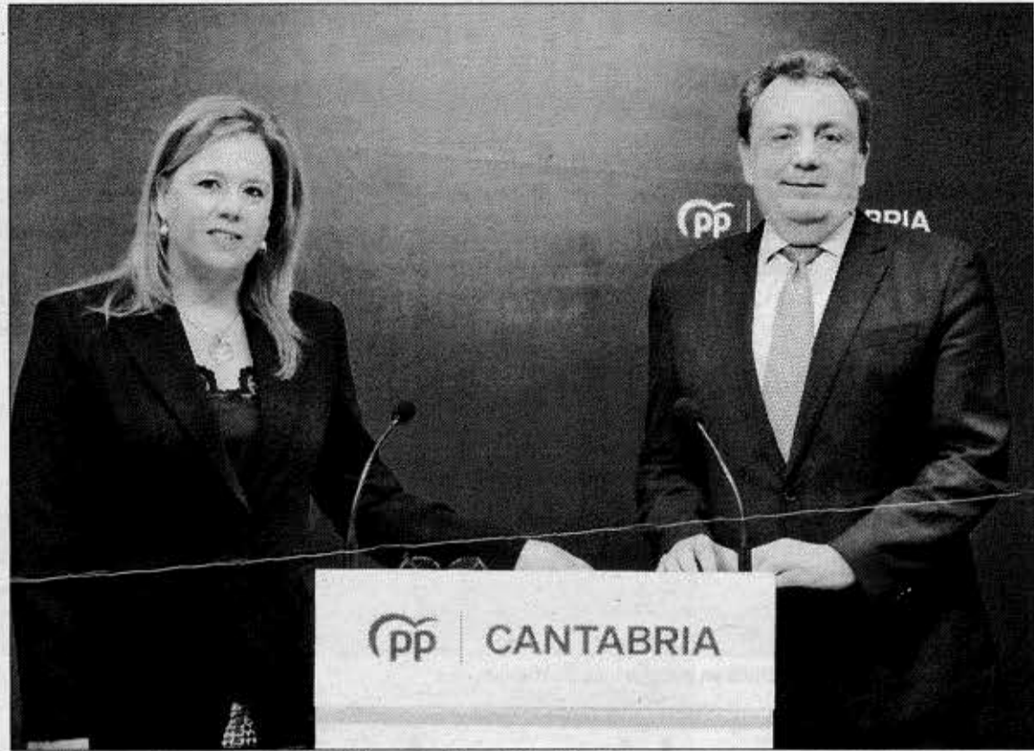
Los parlamentarios nacionales del PP, Elena Castillo y Félix de las Cuevas.

«Cantabria tiene un problema de seguridad ciudadana. Es una realidad que dicen los números y sufren los ciudadanos», ha