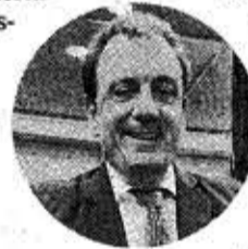
Félix de las Cuevas, diputado del PP en el Congreso.

nacional. El diputado ha alertado sobre los riesgos de deslocalización que podrían enfrentar estas empresas en caso de no recibir el apoyo necesario por parte del Gobierno. La falta de medidas adecuadas para garantizar condiciones competitivas y estables en el sector