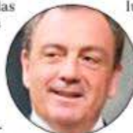
El diputado por Cantabria del PP, Félix de las Cuevas.

Finalmente, el diputado acusó al Gobierno y a sus socios de utilizar estas iniciativas para crear organismos e instituciones que sirvan como refugio para su militancia, especialmente cuando los resultados electorales no les son favorables. «Con iniciativas como esta, su objetivo último poco tiene que ver con la protección ni con la competitividad de nuestra industria», sentenció De las Cuevas, reiterando el rechazo del PP a la propuesta de Sumar.