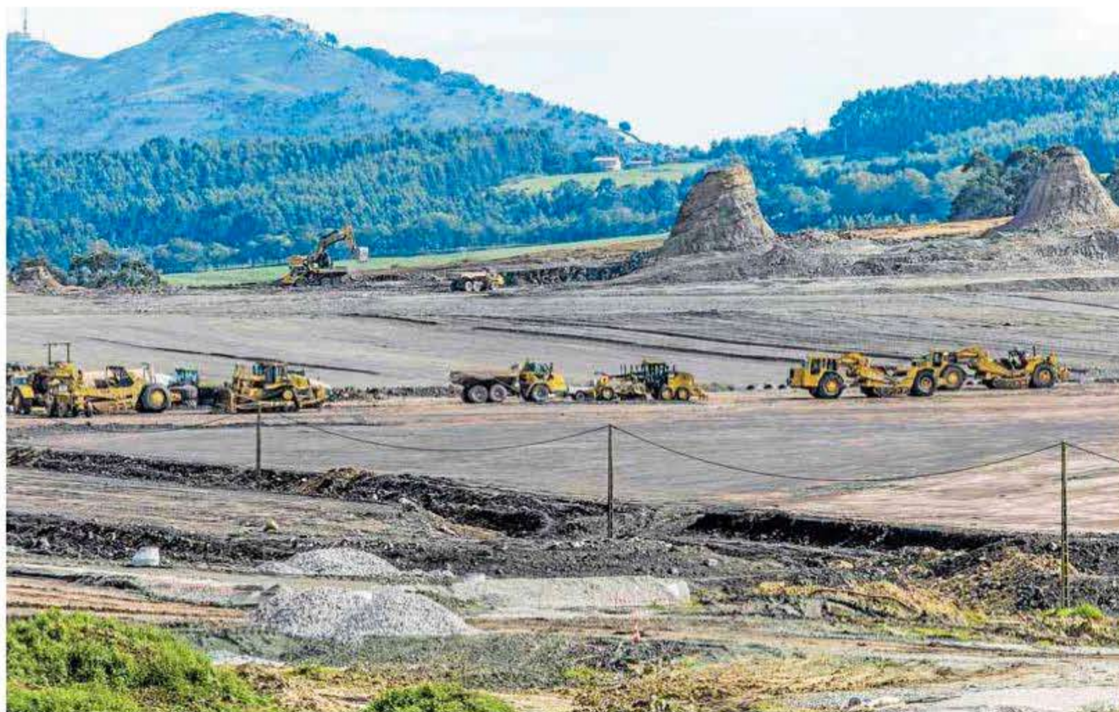
Las máquinas trabajan en las obras de la primera fase de La Pasiiega. En ese espacio debería construirse también la estación intermodal.