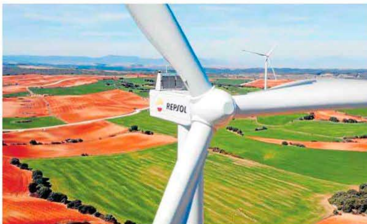
Imagen de un aerogenerador de la compañía Repsol. DM

En cualquier caso, todos los aspectos que figuran en el actual proyecto son susceptibles de cambiar para cumplir los requerimientos de la DIA –en caso de que sea po-